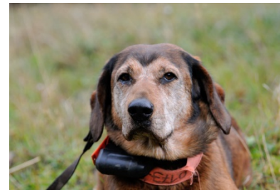
Dino vom Mühl Schlag

Alpenländischen Dachsbracke gestochen wird und mit lautem Brackengeläut im Berg gejagt wird- ein Traum! Am nächsten Morgen erstmal die totale Ernüchterung, es regnete in Strömen. Erhard, Armin, Christine Baur (KassiererIn), Maximilian Stöger und ich fuhren zum Basislager, um ausgiebig eine „Brotzeit“ einzunehmen, so bekamen wir die Regenzeit gut rum. Nach drei Stunden ließ der Regen nach und schwer bepackt ging es in den Berg. Die umfangreiche Fotoausrüstung bestehend aus einem 10 kg schweren Rucksack mit etlichen Objektiven, einer Profifilmkamera und Stativen musste trocken oben ankommen. Erhard, Christine und Maxi hatten ihre Hunde mit dabei, unsere Hauptakteure, die nun