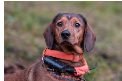
Artimis vom Lichtenbach