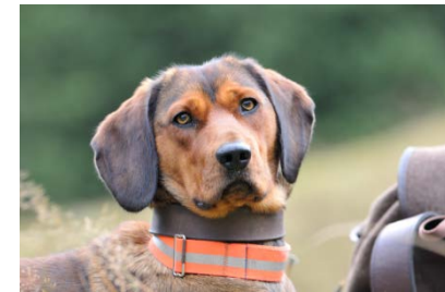
Blaya vom Buchenberg