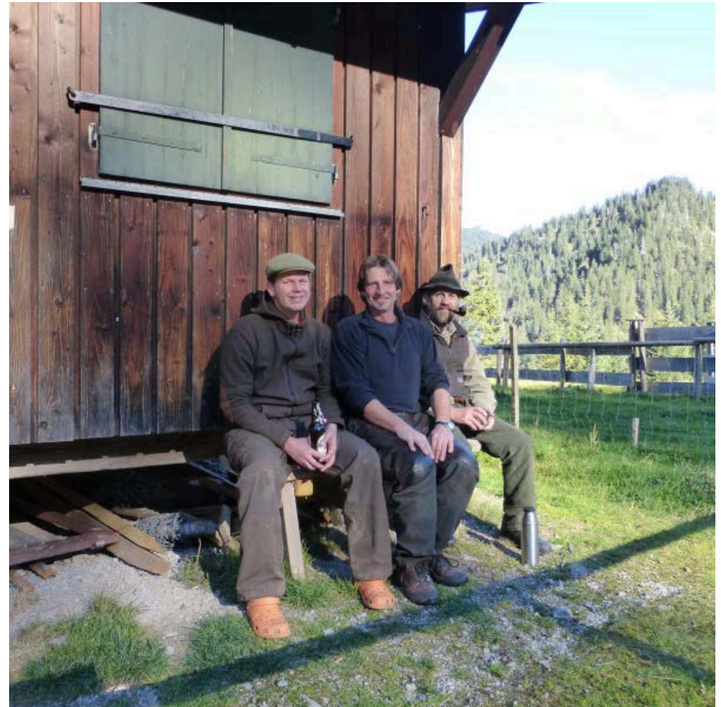
Drei im Berg